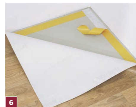
6 Przyciętą wykładzinę można zacząć mocować na przygotowanej dwustronnej taśmie klejącej, rozpoczynając pracę od narożnika pomieszczenia.