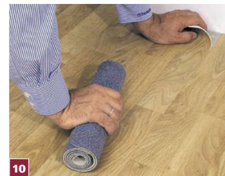
10 Na taśmie klejącej układamy drugie, dołączane pasmo wykładziny i całość dociskamy za pomocą wykonanego samodzielnie wałka dociskowego.