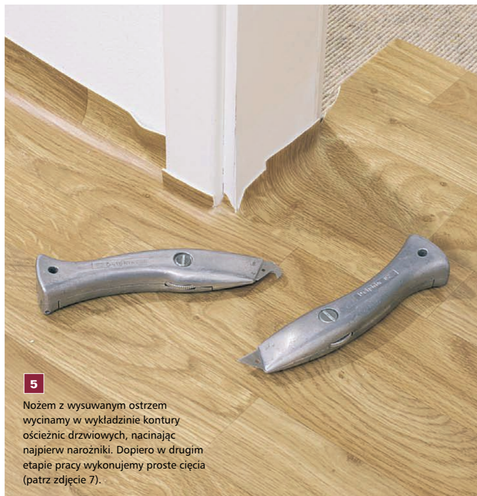
5 Nożem z wysuwającym ostrzem wycinamy w wykładzinie kontury ościeżnic drzwiowych, nacinając najpierw narożniki. Dopiero w drugim etapie pracy wykonujemy proste cięcia (patrz zdjęcie 7).