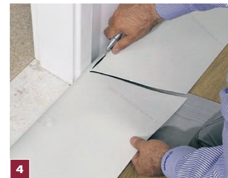
4 Na progach drzwi oraz we wnękach wykładzinę przycinamy z kilkucentymetrowym zapasem.