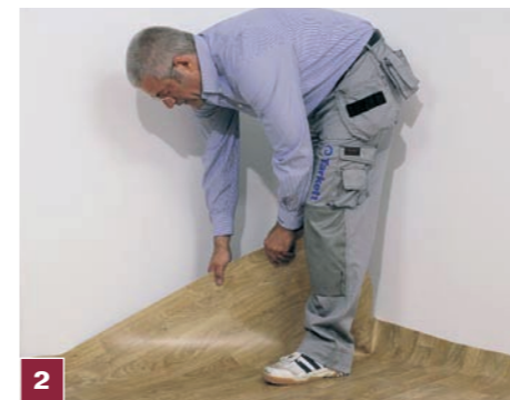
2 Rozwinięte z rolki pasmo wykładziny układamy w jednym z prostokątnych kątów pomieszczenia.