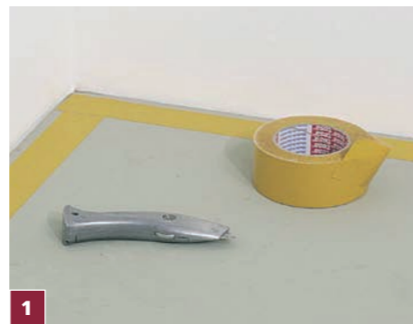
1 Po zdemontowaniu listew przypodłogowych przy ścianach na całym obwodzie podłogi przyklejamy dwustronną taśmę klejącą odporną na działanie zmiękczaczy.

Narzędzia: specjalna szyna do cięcia wykładzin, metrówka, szpachelka z drobnymi zębami do nakładania kleju, noże z prostym i hakowym ostrzem, młotek i wykonany samodzielnie z kawałka wykładziny dywanowej wałek dociskowy (wykładzinę smarujemy klejem, zwijamy i pozostawiamy do stwardnienia).