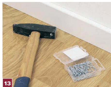
13 Mocujemy listwy przypodłogowe, które skutecznie zamaskują niewielkie niedokładności – do 5 mm – powstałe w trakcie docinania wykładziny.