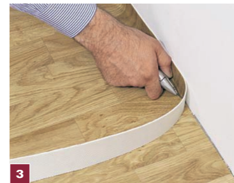
3 Nożem z ostrzem hakowym przycinamy wykładzinę, dostosowując ją do kształtu pomieszczenia. Pamiętajmy, by pozostawić szczelinę dylatacyjną 1–3 mm.