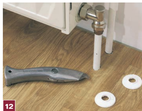
12 Na rury zakładamy dobrane kolorystycznie rozety. Można je kupić w marketach budowlanych – także o fakturze przypominającej drewno.