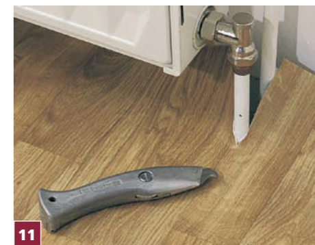
11 Przy rurach wykładzinę najpierw nacinamy, a następnie wykonujemy okrągłe otwory.