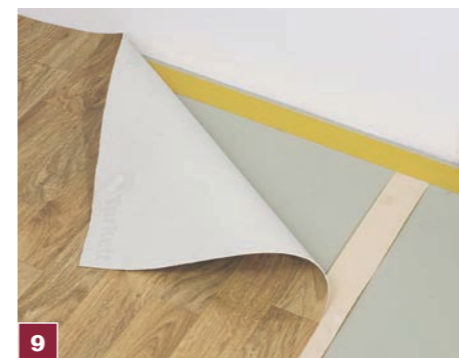
9 W miejscu łączenia pasma wykładziny podklejamy jednostronną taśmą klejącą. Jeśli używamy dwustronnej taśmy klejącej, nie zrywamy folii ochronnej ze spodu.