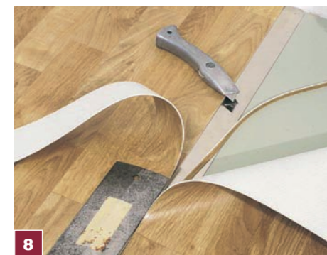
8 Jeśli układamy więcej niż jedno pasmo wykładziny, sąsiadujące pasma ułożone na zakład dopasowujemy jednym cięciem przechodzącym równocześnie przez obie warstwy wykładziny.